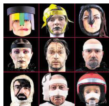
Raster aller beteiligten Figuren in Maske.